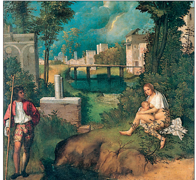
Ausstellung „Giorgione. Mythos und Enigma“, „La Tempesta“ (Das Gewitter)

Herrlich Wild. Höfische Jagd in Tirol (16. 6.–31. 10. 2004).