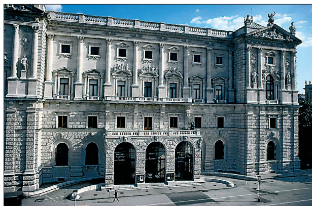
Außenansicht des Museums für Völkerkunde