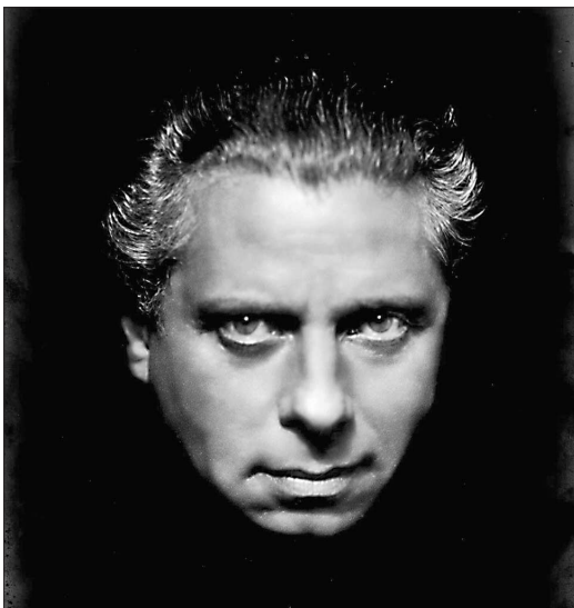
Ausstellung „Max Reinhardt und Österreich“, Max Reinhardt um 1930

Brecht & Piscator. Experimentelles Theater im Berlin der 20er Jahre (30. 1.–12. 4. 2004).