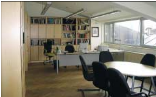
Fertiggestellter Ausbau des Dachgeschoßes

Die seit seiner Schließung am 1. 3. 2004 mit zunehmender Intensität durchgeführten Sanierungsmaßnahmen am Museum für Völkerkunde Wien haben mit dem Ende Oktober 2005 erfolgten Bezug der neuen Arbeitsplätze im ausgebauten Dachgeschoß des Corps de Logis-Traktes der Neuen Burg ein erstes sichtbares Ergebnis erbracht.