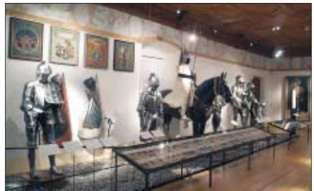
Sonderausstellung „Wir sind Helden“ im Schloss Ambras

Meisterwerke der Geigenbaukunst. Die Streichinstrumentensammlung der Oesterreichischen Nationalbank (23.–28. 11. 2005)