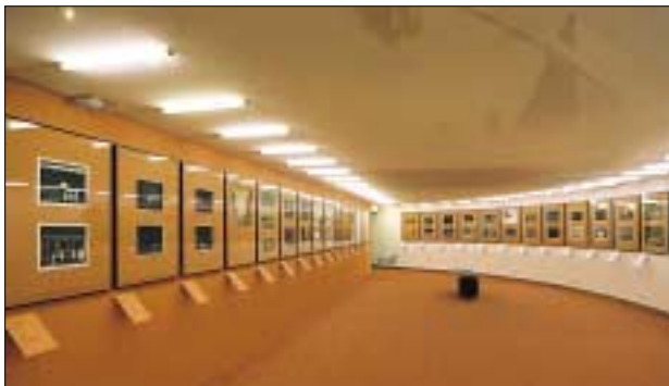
Ausstellung „Aus Burg und Oper“ Die Häuser am Ring von ihrer Eröffnung bis 1955

Aus Burg und Oper. Die Häuser am Ring von ihrer Eröffnung bis 1955 (1. 6. 2005–5. 3. 2006).