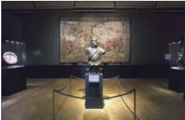
Sonderausstellung „Meisterwerke aus den habsburgischen Kunst- und Wunderkammern“

Meisterwerke aus den habsburgischen Kunst- und Wunderkammern (12. 7.–18. 9. 2005).