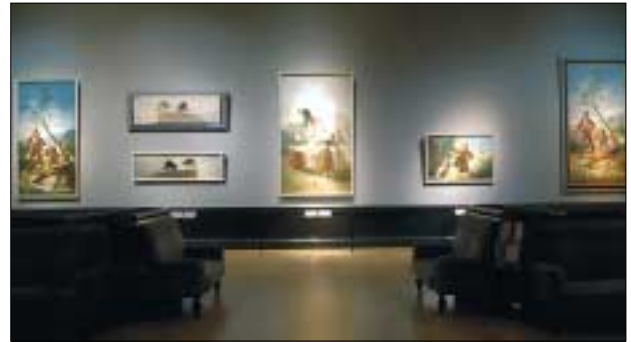
Sonderausstellung „Francisco de Goya 1746–1828“