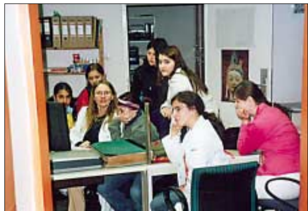
Töchtertag am PBM

Erstmals hat das PBM am diesjährigen Töchtertag teilgenommen.