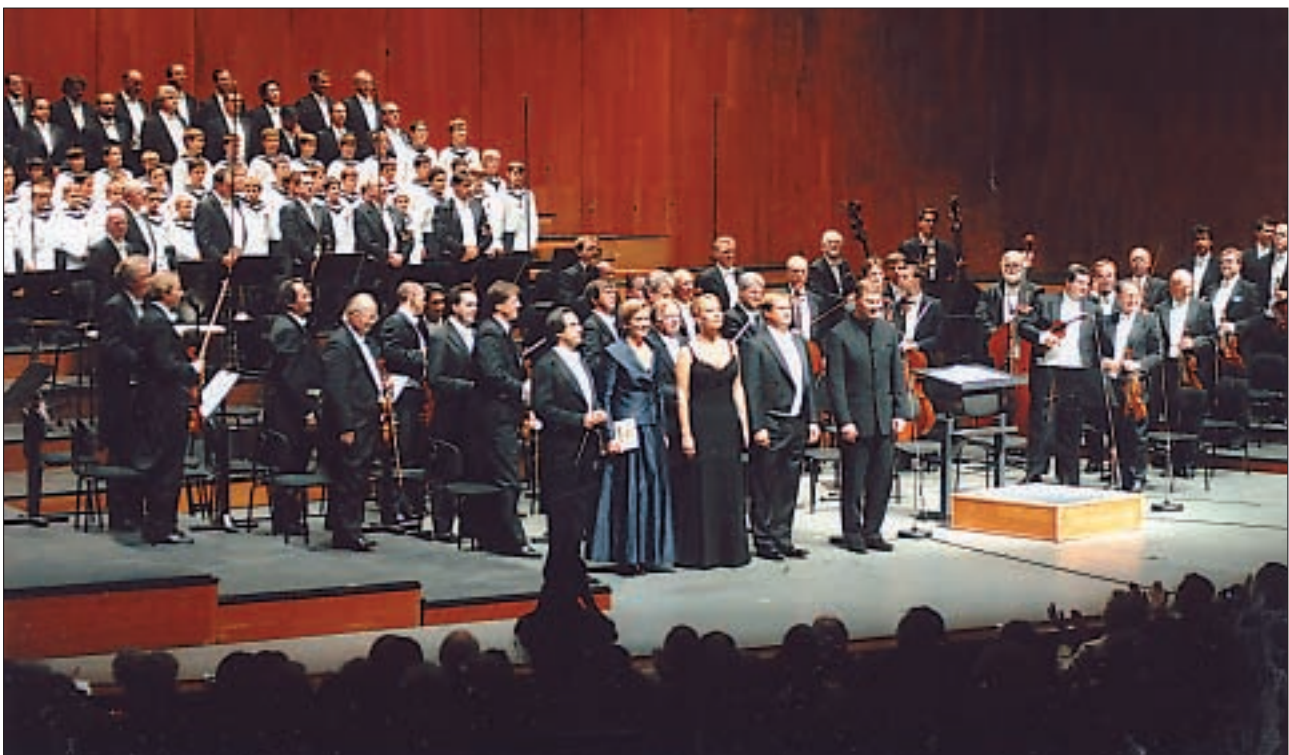
Auftritt im Großem Festspielhaus unter ihrem Ehrendirigenten Riccardo Muti, Salzburger Festspiele, 6. 8. 2006