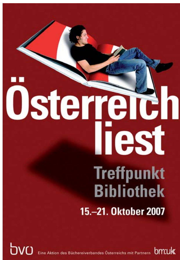
Österreich liest, Plakat

Ebenfalls vom Bundesministerium für Unterricht, Kunst und Kultur gefördert wird das Projekt Rezensionen Online www.rezensionen.at . Das Österreichische Bibliothekswerk www.biblio.at hat den größten frei zugänglichen Besprechungspool im deutschen Sprachraum aufgebaut, der bereits von 17 Zeitschriften/Institutionen beschickt wird und Zugriff auf nahezu 30.000 Buchbesprechungen bietet. Das Projekt Katalogisate online www.katalogisate.at vernetzt die Arbeit von wissenschaftlichen Bibliotheken, öffentlichen und Schulbüchereien und bietet allen BibliothekarInnen die Möglichkeit, frei, uneingeschränkt und kostenlos Katalogisate aus dem Internet herunterzuladen.