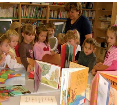
Büchereien spannend präsentiert

Aus administrativen Gründen werden die Förderungen, die im Rahmen der „gesamtosterreichischen Büchereiförderung“ zur Verfügung gestellt werden, für die Jahre 2007 und 2008 zusammengezogen. Die Auszahlung erfolgt 2008.