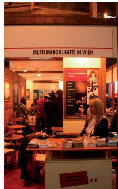
Bundesmuseen auf Tourismusmessen

Das Bundesministerium für Unterricht, Kunst und Kultur ist Mitglied des Art Cluster Vienna, einem Zusammenschluss verschiedener Institutionen im Bereich bildende Kunst. Dieser hat es sich zum Ziel gesetzt, eine für alle Beteiligten Gewinn bringende Verbindung von Kunst und Wirtschaft im Wiener Raum zu schaffen. Der als Verein konzipierte Cluster, bestehend aus Kunstmuseen, Kunsthochschulen und Galerien, will Aktivitäten der bildenden Kunst bündeln und gemeinsam vermarkten. Art Cluster Vienna veranstaltet dazu seit 2005 die Vienna Art Week, bei der ein nationales und internationales Fachpublikum zum Erfahrungsaustausch zusammentrifft. Führungen, Vorträge, Diskussionen und Gespräche boten auch 2007 den Rahmen für eine erfolgreiche Intensivierung der Kontakte zwischen SammlerInnen, MuseumsdirektorInnen, KuratorInnen, GaleristInnen, KunstkritikerInnen, JournalistInnen und anderen Persönlichkeiten aus Kultur, Wirtschaft und Politik.