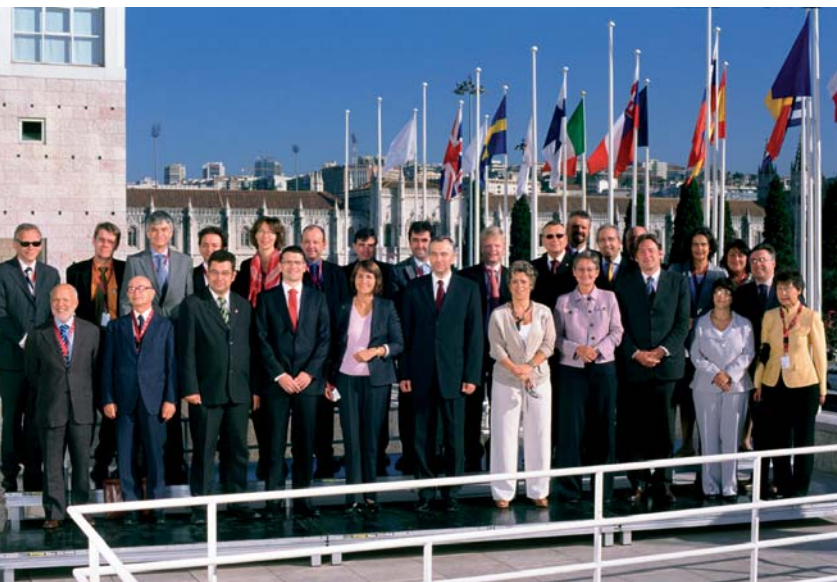
KulturministerInnentreffen in Lissabon

unter reger Beteiligung der österreichischen Kunst- und Kulturschaffenden im WUK/Wien stattfand. Bundesministerin Dr. Claudia Schmied eröffnete die Konferenz mit den Worten: „Dialog, Austausch und Diskurs sind die Schlüssel zum Ziel, EU-Themen in eine breite Öffentlichkeit zu tragen. Bei der neuen EU-Kulturagenda geht es darum, die gesamtgesellschaftliche Wirkung von Kultur aufzuzeigen und Kultur als Politikfeld im europäischen Kontext stärker zu positionieren.“