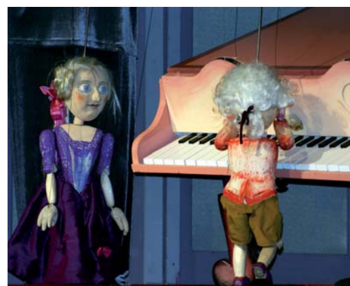
Fantasima 2007: Das Zaubercembalo (Puppenbühne Maribor)