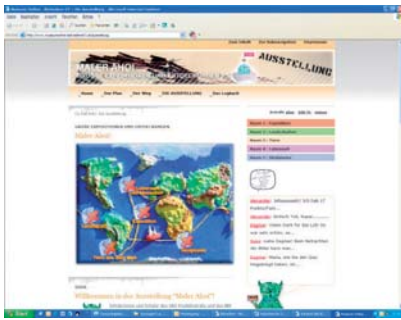
„Vom Kunstspeicher in den Kunsttempel“

ten wurden von einer Jury die besten drei ermittelt und mit den eigens für M:O entworfenen Awards ausgezeichnet: