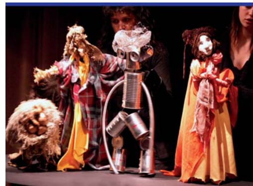
ANIMA 2007: Der Zauberer von Oz (Theaterwerkstatt Dölsach)

Diese Aktivitäten und Projekte wurden mit einer Gesamtsumme von € 0,166 Mio unterstützt.